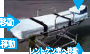
レントゲン室へ移動