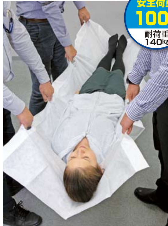
●担架棒を差し込むことにより、安全荷重が強化されました。[意匠登録第1642884号取得]

CAPディスポストレッチャー・プラス TSK-201 オープン価格 ※最小発注単位:10枚