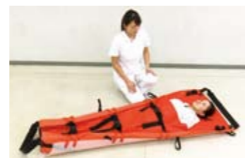
6 特に足側のベルトを絞り、船型にして傷病者を包み込むように固定します。