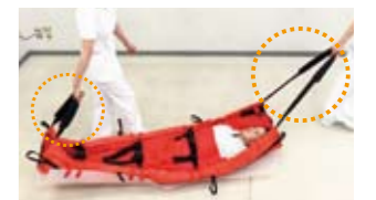
ループベルト(前後) 可動式のループベルトが様々な搬送を可能にします。