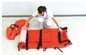
1 エアーストレッチャーをキャリーバックから出し広げます。