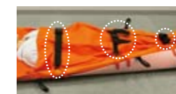
安全ベルト(3ヶ所) 安全ベルトで傷病者を固定して搬送します。