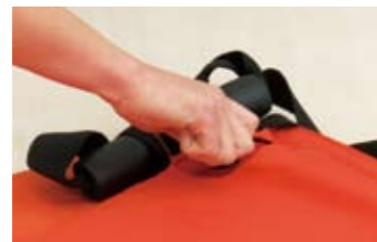
2 エアバルブを反時計回りに回してバルブを開けます。