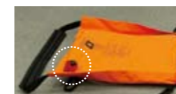
自吸式エアーマット エアーマットは、バルブを開けると空気が自動的に入る自吸式です。さらに繰り返し使用が可能です。