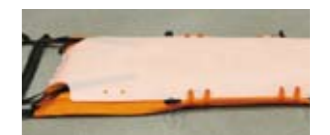
底部特殊ポリエチレン(PE)板 底部には特殊ポリエチレン(PE)板を装着、搬送時ガレキやガラスなどの散乱物や凹凸の衝撃から搬送者を守ります。