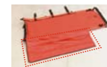
ワンタッチカバー(ラップ) ワンタッチカバーで傷病者を優しく包み込みます。