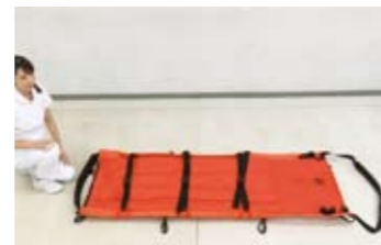
3 約60秒で空気は自動的に入ります。