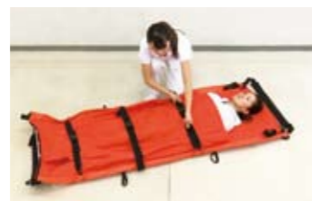
5 ワンタッチカバー(ラップ)を掛け、ベルトを装着します。