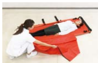
4 ワンタッチカバー(ラップ)を払って、傷病者をエアーマットの上に寝かせます。