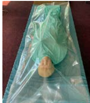
写真：透明特殊フィルム

サイズ：使用時 220cm×84cm 収納時 約42cm×28cm×2cm 重さ：約500g 仕様：トリプルチャック、スライダー2個 材質：シリカ蒸着透明特殊フィルム 酸素透過度：5.0ml/(m 2 ・d・MPa) 水蒸気透過度：0.5g/(m 2 ・d)