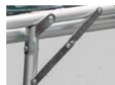
足折れ防止ストッパー