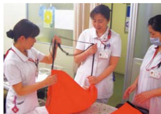
製品開発にご協力頂いた高知赤十字病院看護師の皆様

東日本大震災以降、大人用の搬出用具が多くの 病院等で装備されてきましたが、新生児対策は 不十分でした。そこで弊社では災害時等に病院 内の新生児を避難先まで抱えて運ぶための 搬送具を、現場の看護師の皆さんと共同開発を いたしました。お母さんと一緒に安全搬送出来る 「おくるみ」。そして、限られた時間の内で一人 でも多くの新生児を同時に搬出できる「トリプル」。 これらの製品は、現場の看護師の方々のご意見 を参考に開発・改良された製品です。